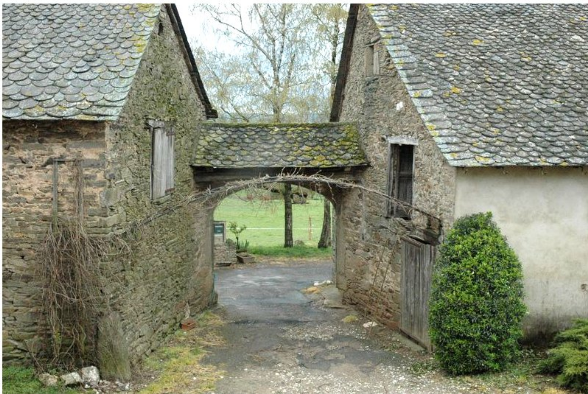
Porche de la ferme Henri Albinet du Puech Issaly de Meljac vue vers l'extérieur de la cour - (1)