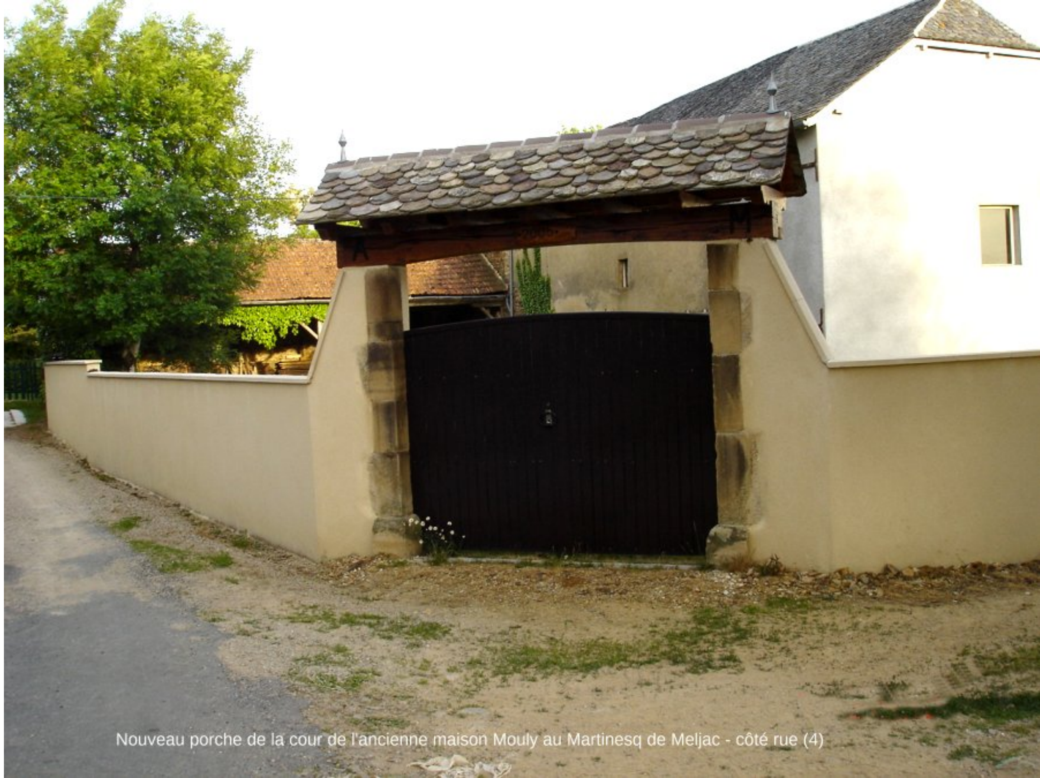
Nouveau porche de la cour de l'ancienne maison Mouly au Martinesq de Meljac - côté rue (4)