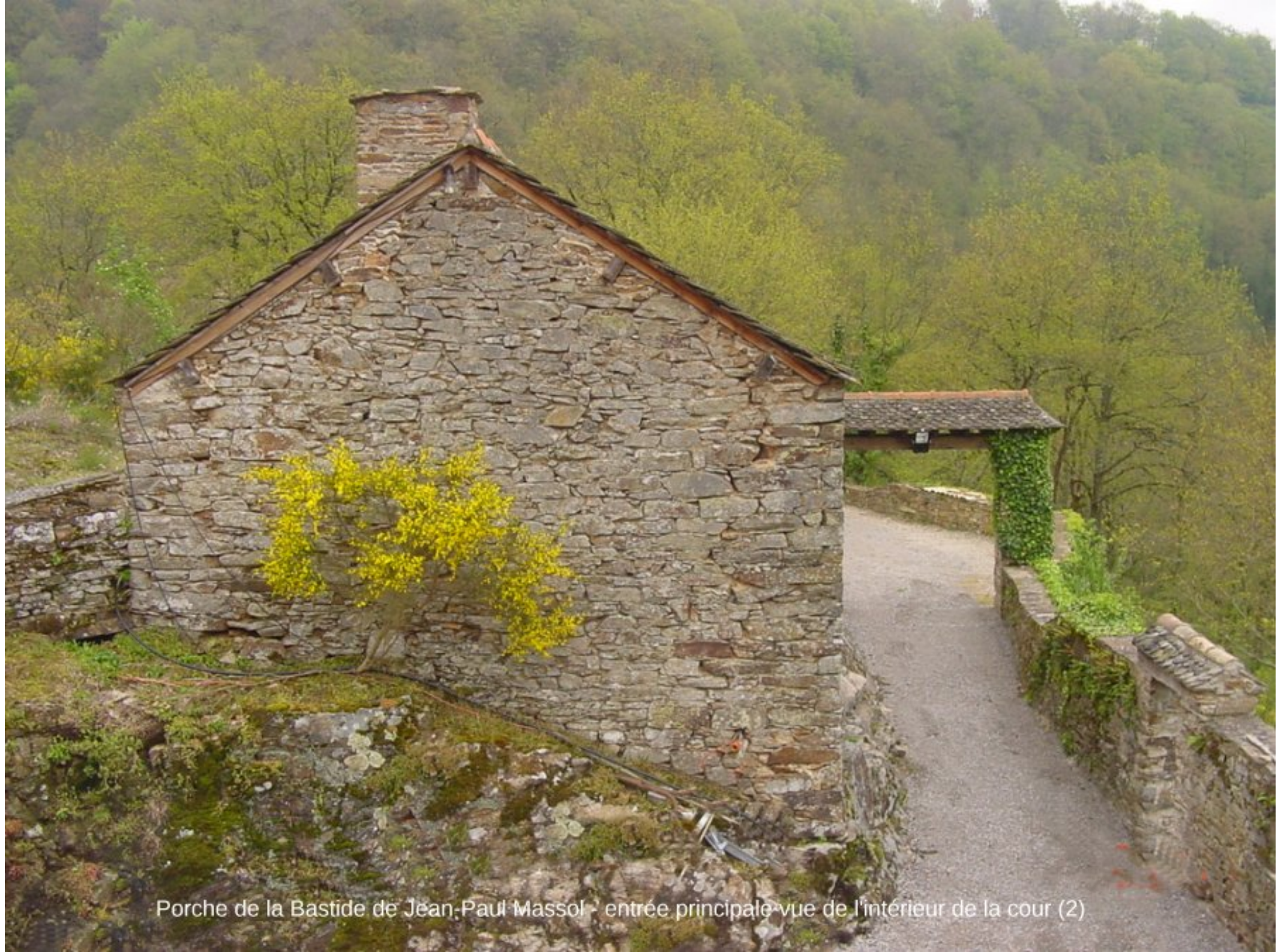
Porche de la Bastide de Jean-Paul Massol - entrée principale vue de l'intérieur de la cour (2)