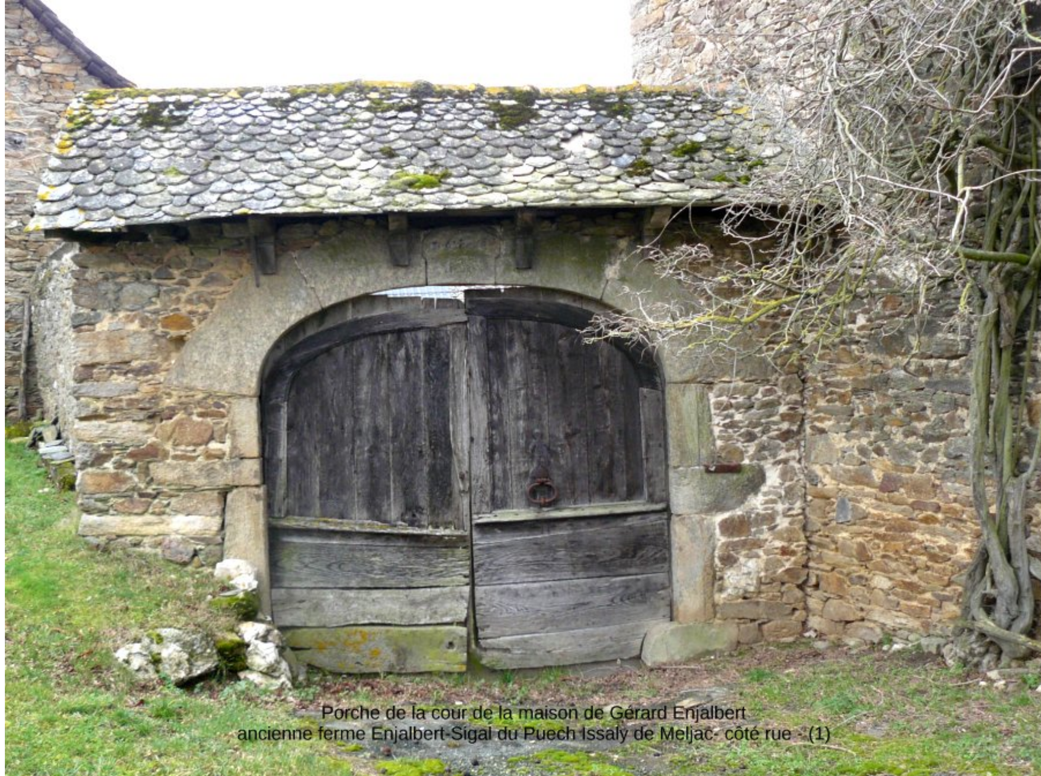
Porche de la cour de la maison de Gérard Enjalbert ancienne ferme Enjalbert-Sigal du Puech Issaly de Meljac - côté rue - (1)