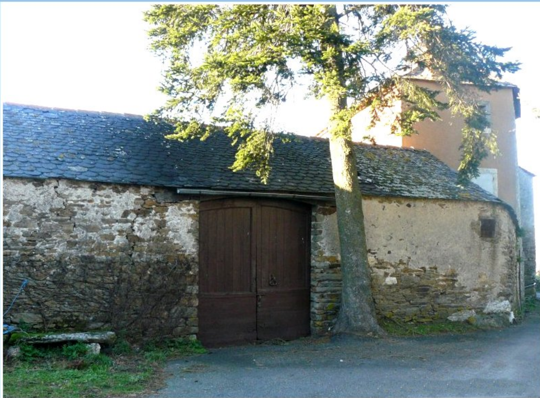
Porche de la cour de l'ancienne maison Sirmin au Bourg de Meljac - côté rue