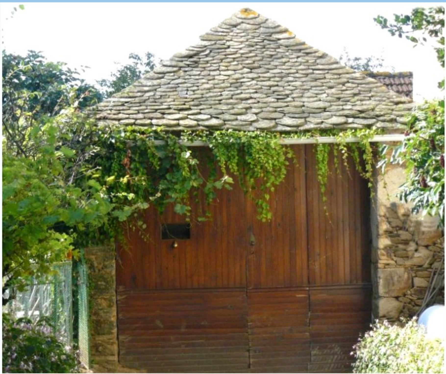
Porche de la cour de la maison de Guy Barthes au Martinesq de Meljac - côté rue