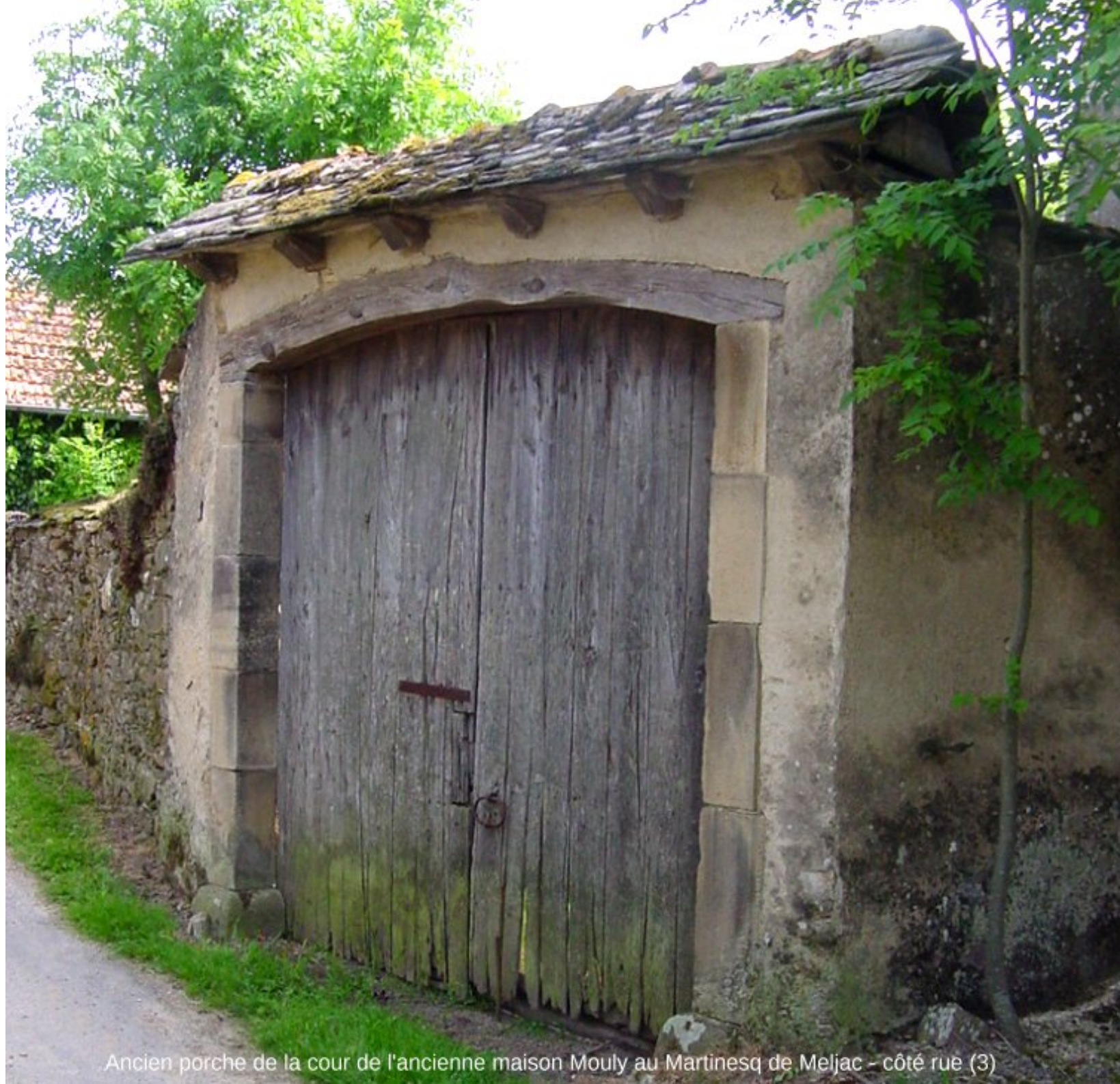
Ancien porche de la cour de l'ancienne maison Mouly au Martinesq de Meljac - côté rue (3)