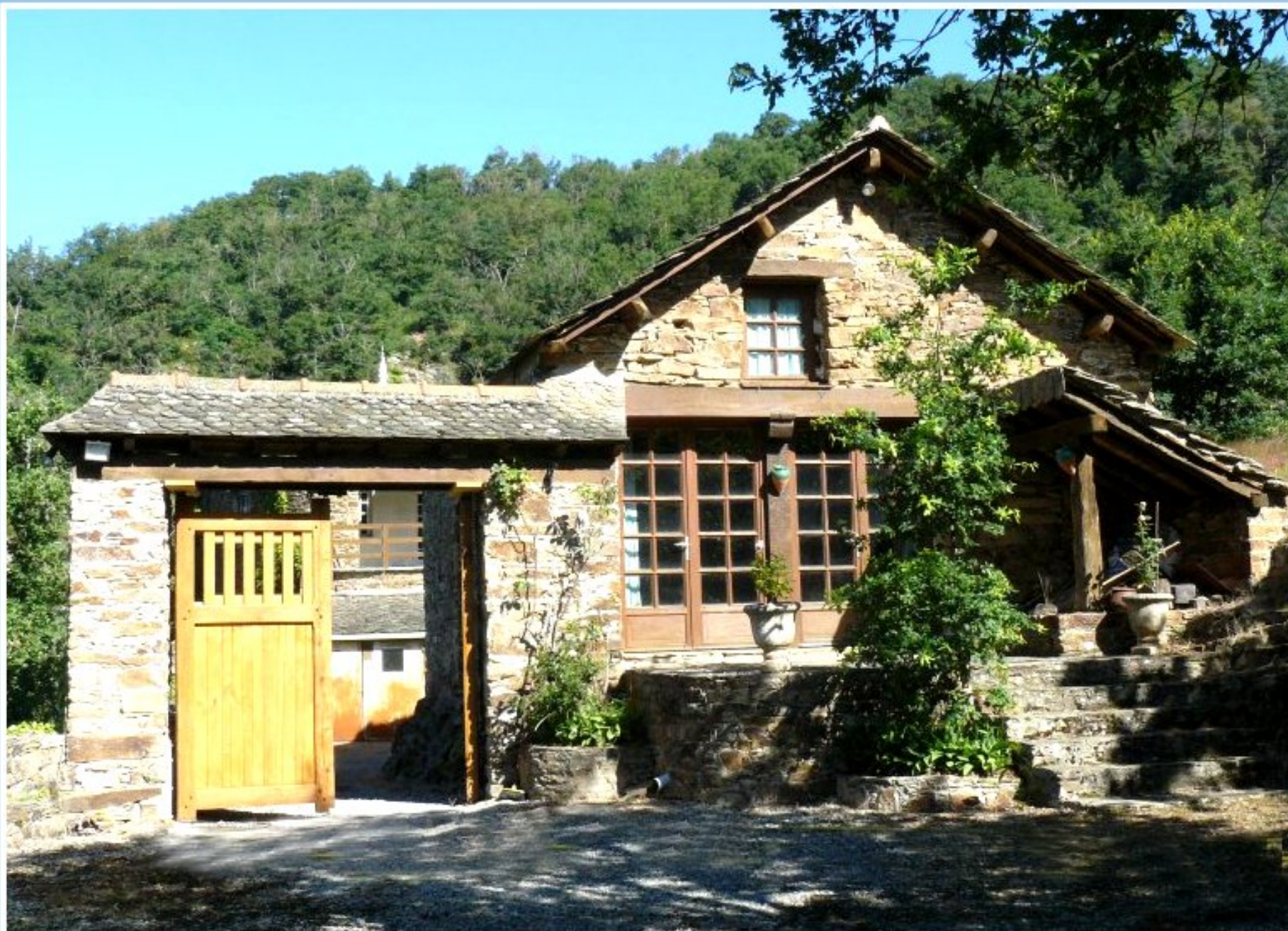
Porche de la Bastide de Jean-Paul Massol - entrée principale côté chemin (1)