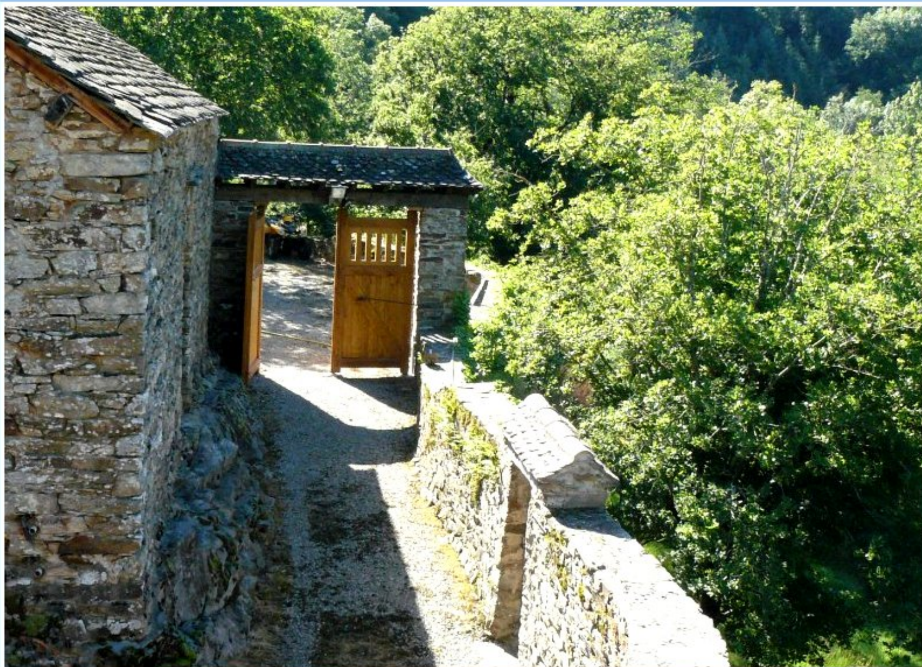
Porche de la Bastide de Jean-Paul Massol - entrée principale vue de l'intérieur de la cour avec sur la droite un petit porche sur porte ouvrant sur le vide (3 )