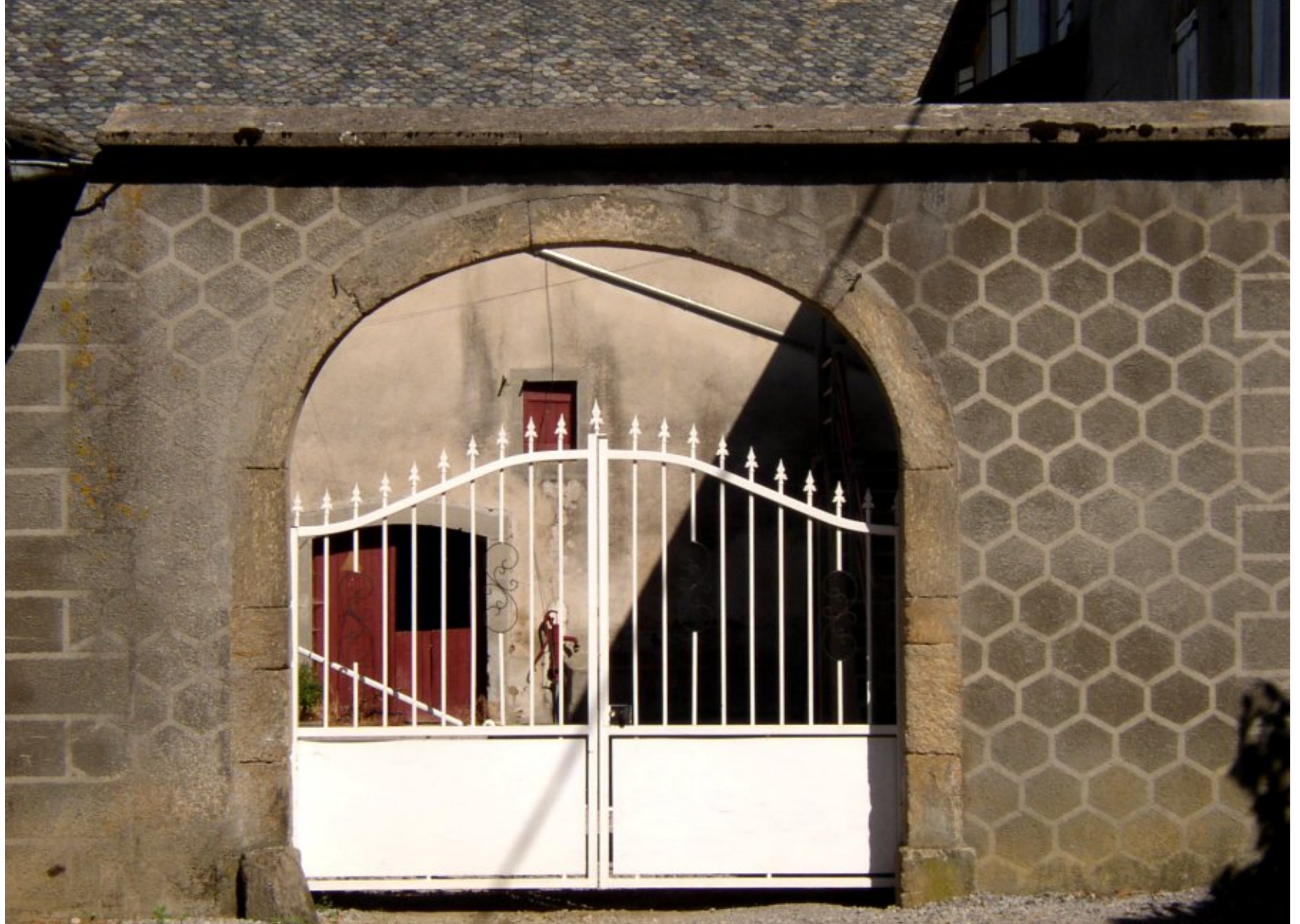
Porche de la cour de la ferme de Xavier Mazars de la Bessière de Meljac