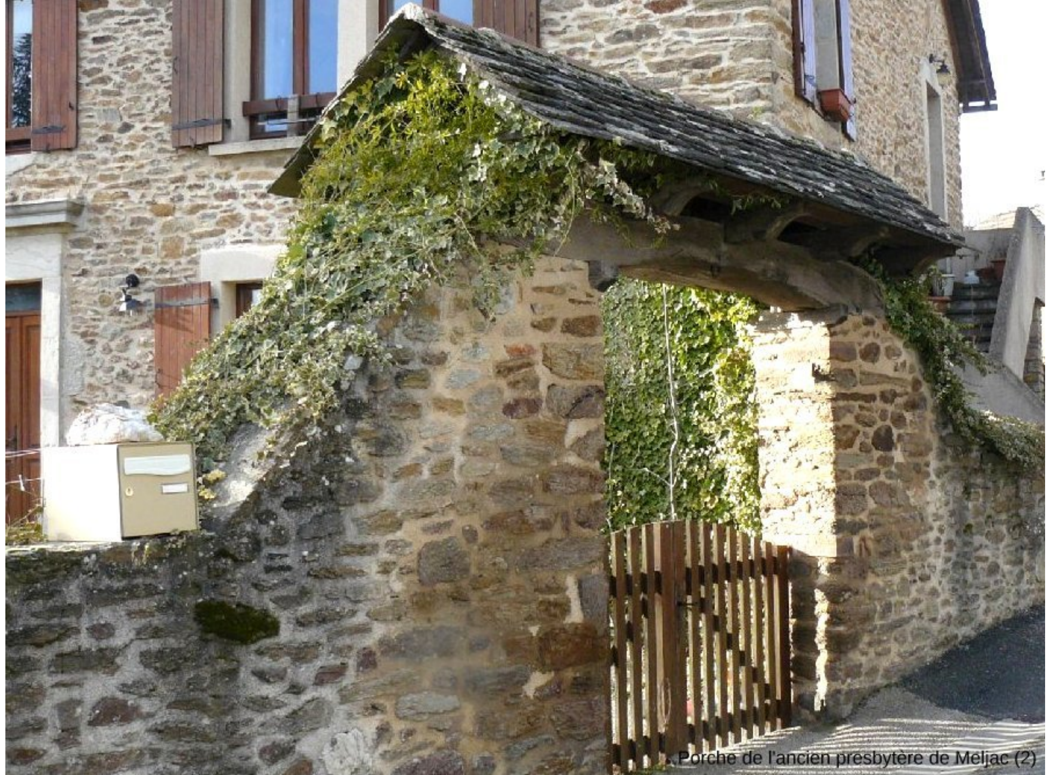
Porche de l'ancien presbytère de Meljac (2)