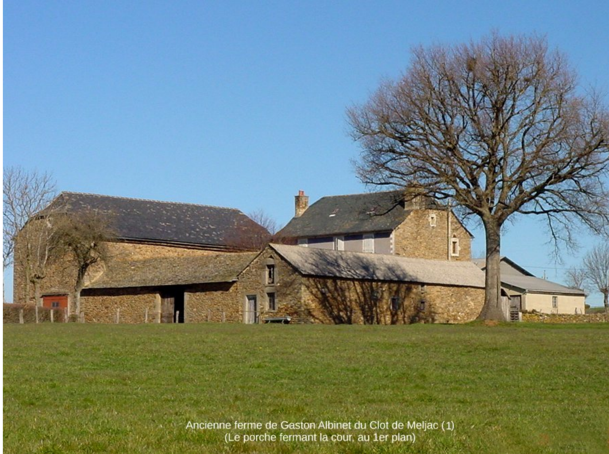
Ancienne ferme de Gaston Albinet du Clot de Meljac (1) (Le porche fermant la cour, au 1er plan)