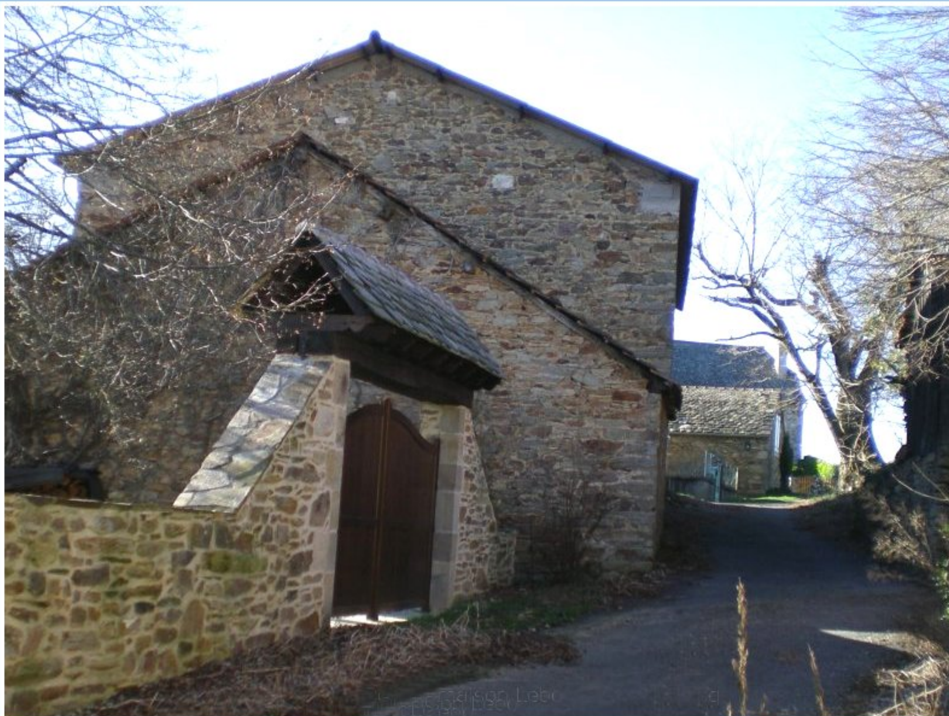
Porche de la cour de la maison de Danièle Lebon au Martinesq de Meljac côté rue - (1)