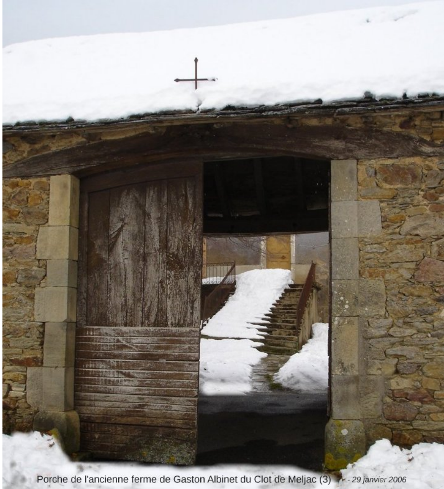
Porche de l'ancienne ferme de Gaston Albinet du Clot de Meljac (3) - 29 janvier 2006