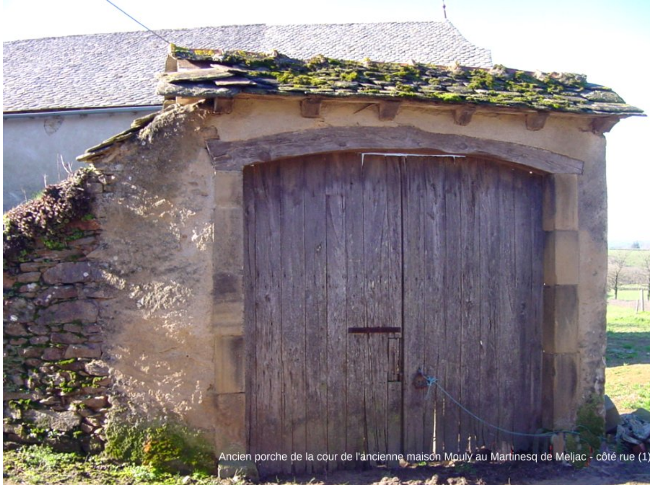
Ancien porche de la cour de l'ancienne maison Mouly au Martinesq de Meljac - côté rue (1)