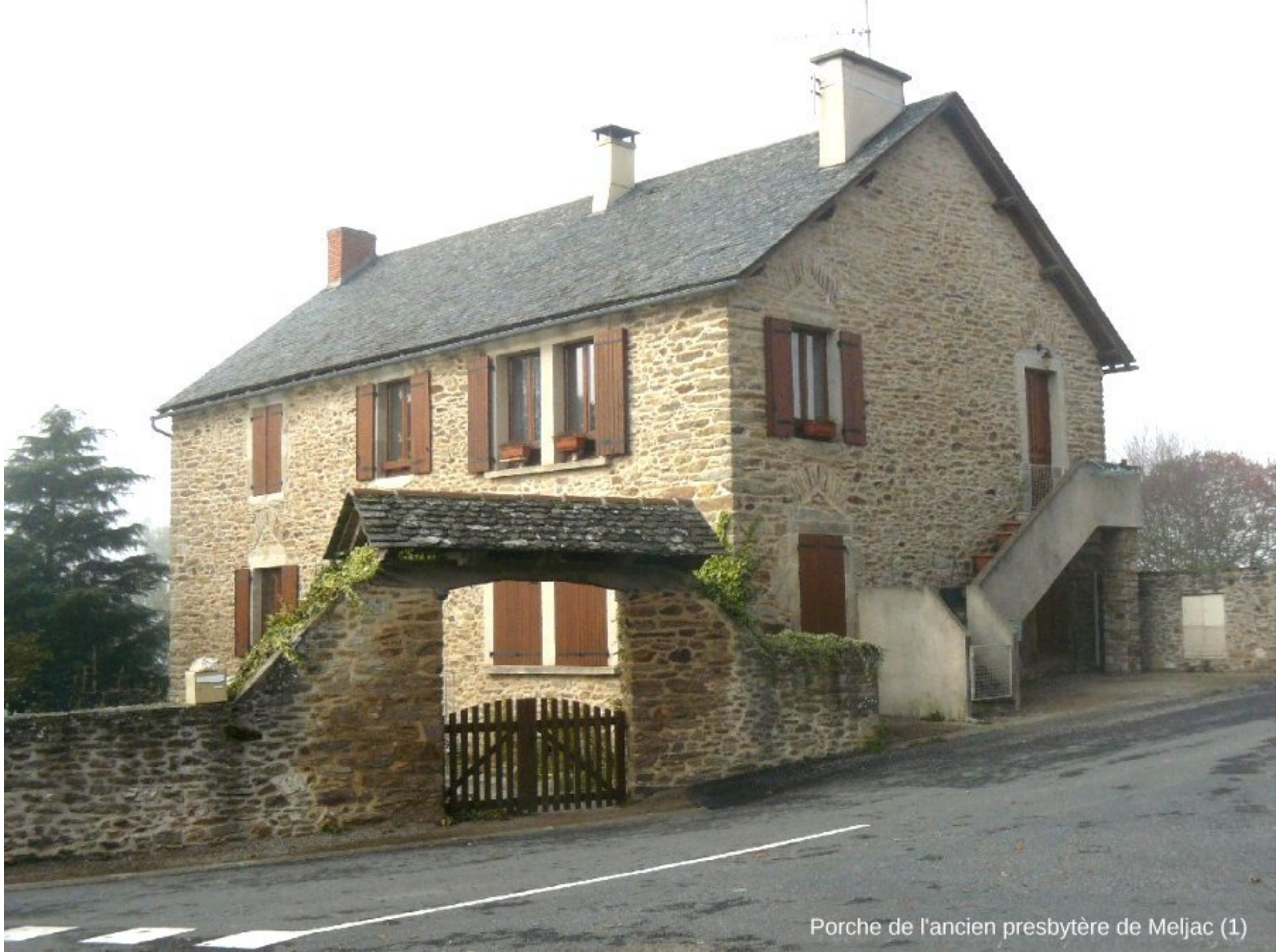
Porche de l'ancien presbytère de Meljac (1)