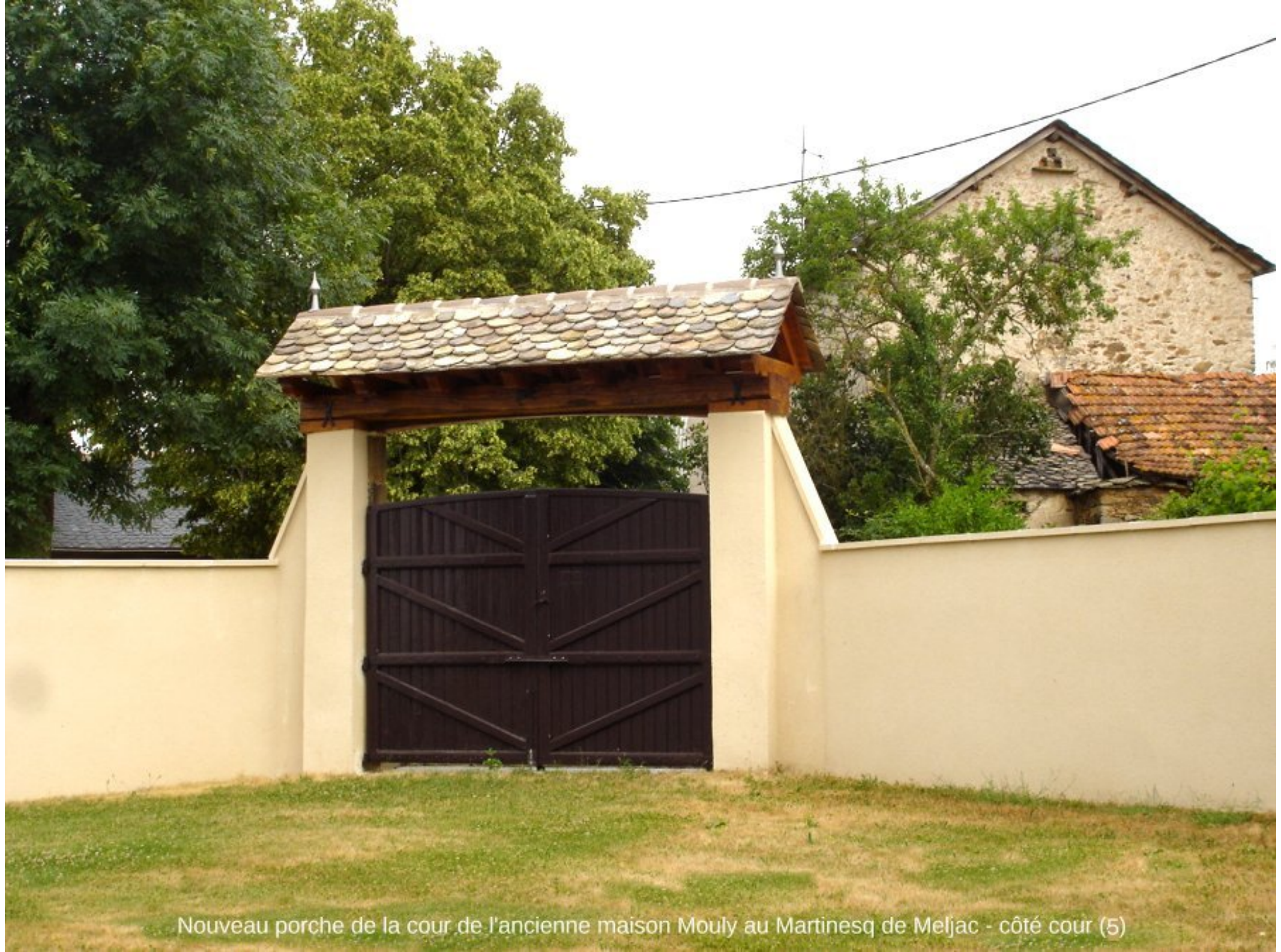
Nouveau porche de la cour de l'ancienne maison Mouly au Martinesq de Meljac - côté cour (5)