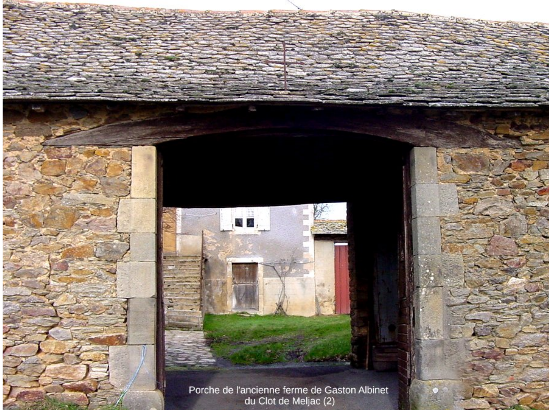
Porche de l'ancienne ferme de Gaston Albinet du Clot de Meljac (2)