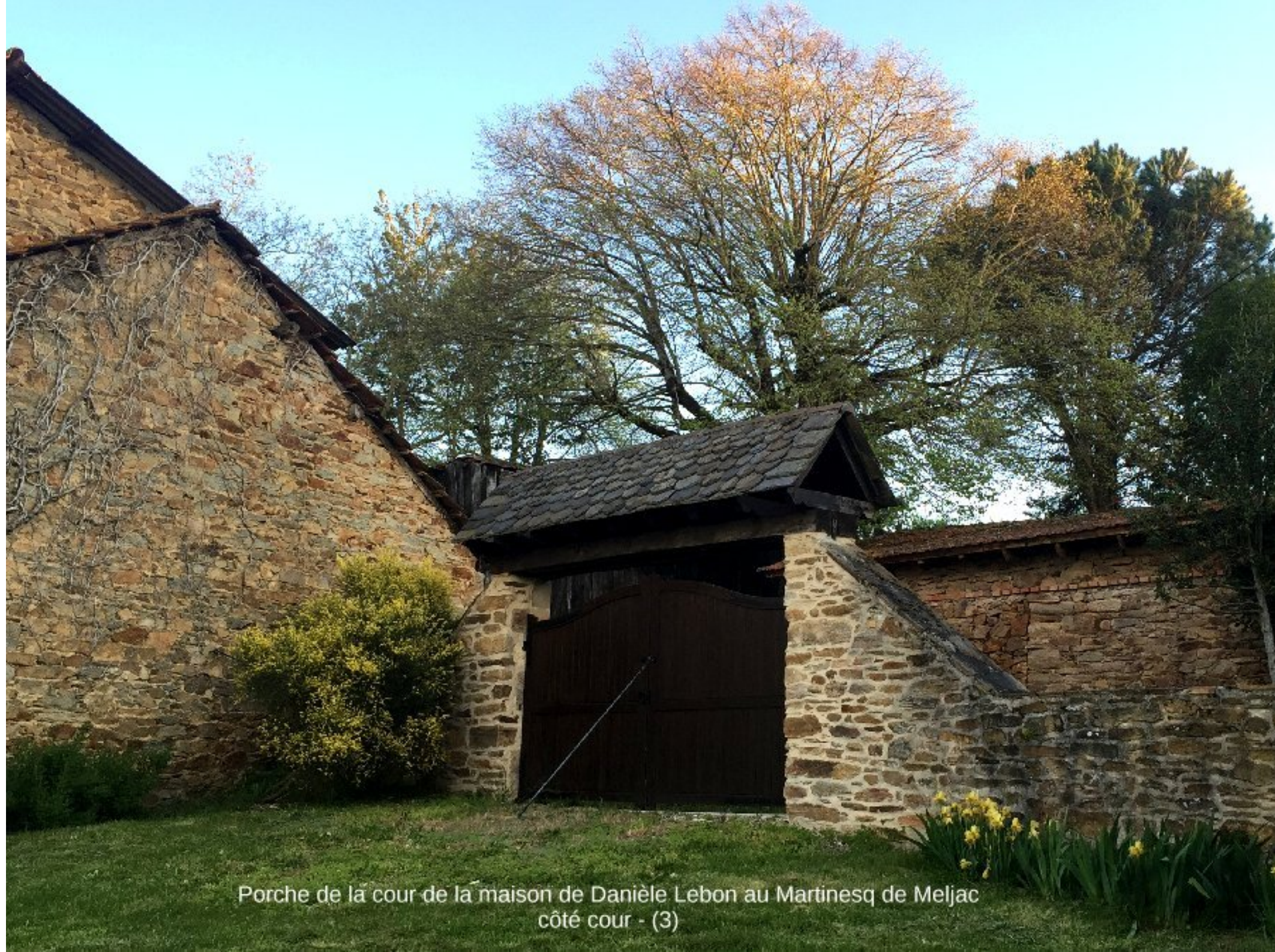
Porche de la cour de la maison de Danièle Lebon au Martinesq de Meljac côté cour - (3)