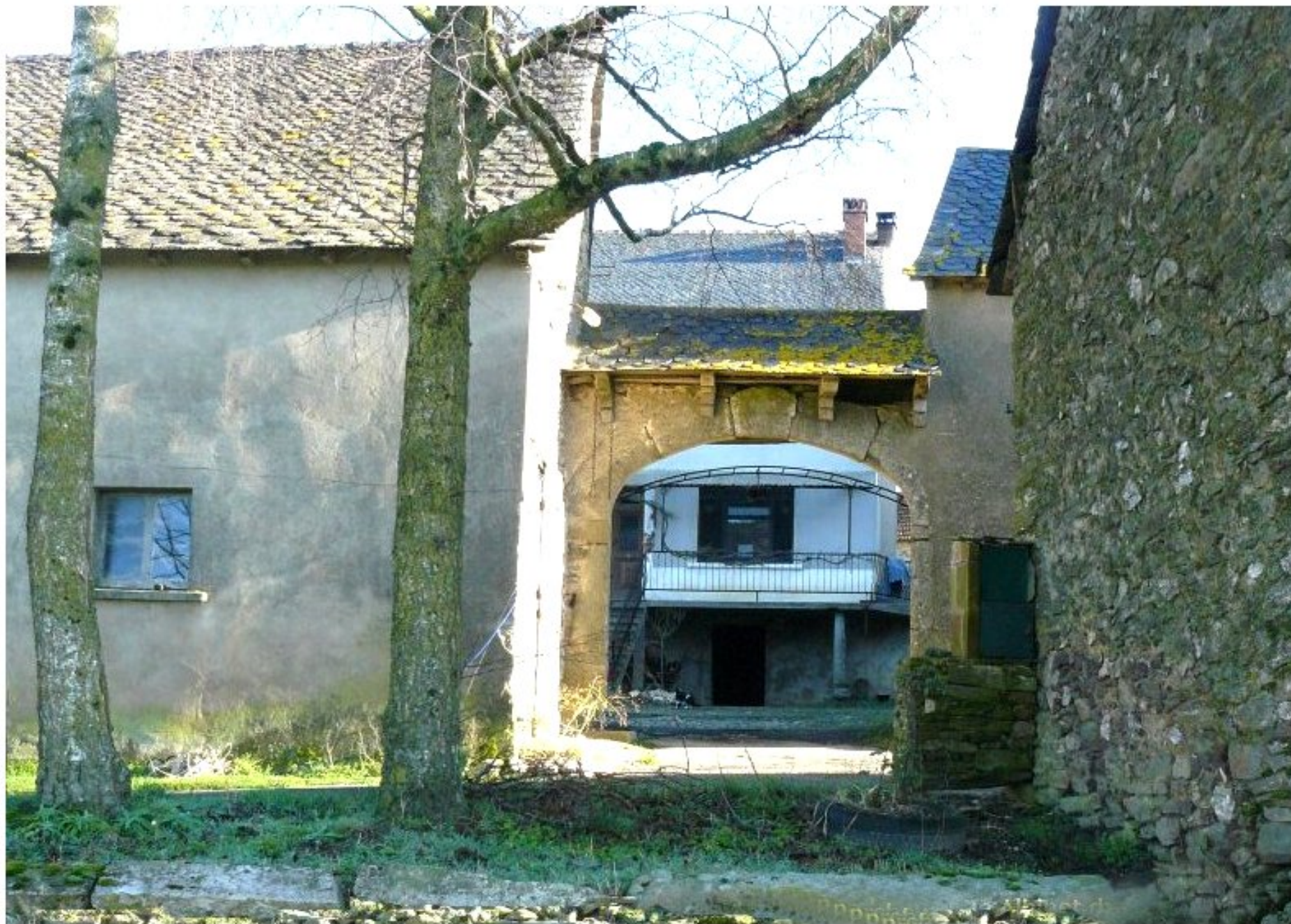
Porche de la ferme Henri Albinet du Puech Issaly de Meljac vue vers l'intérieur de la cour - (2)