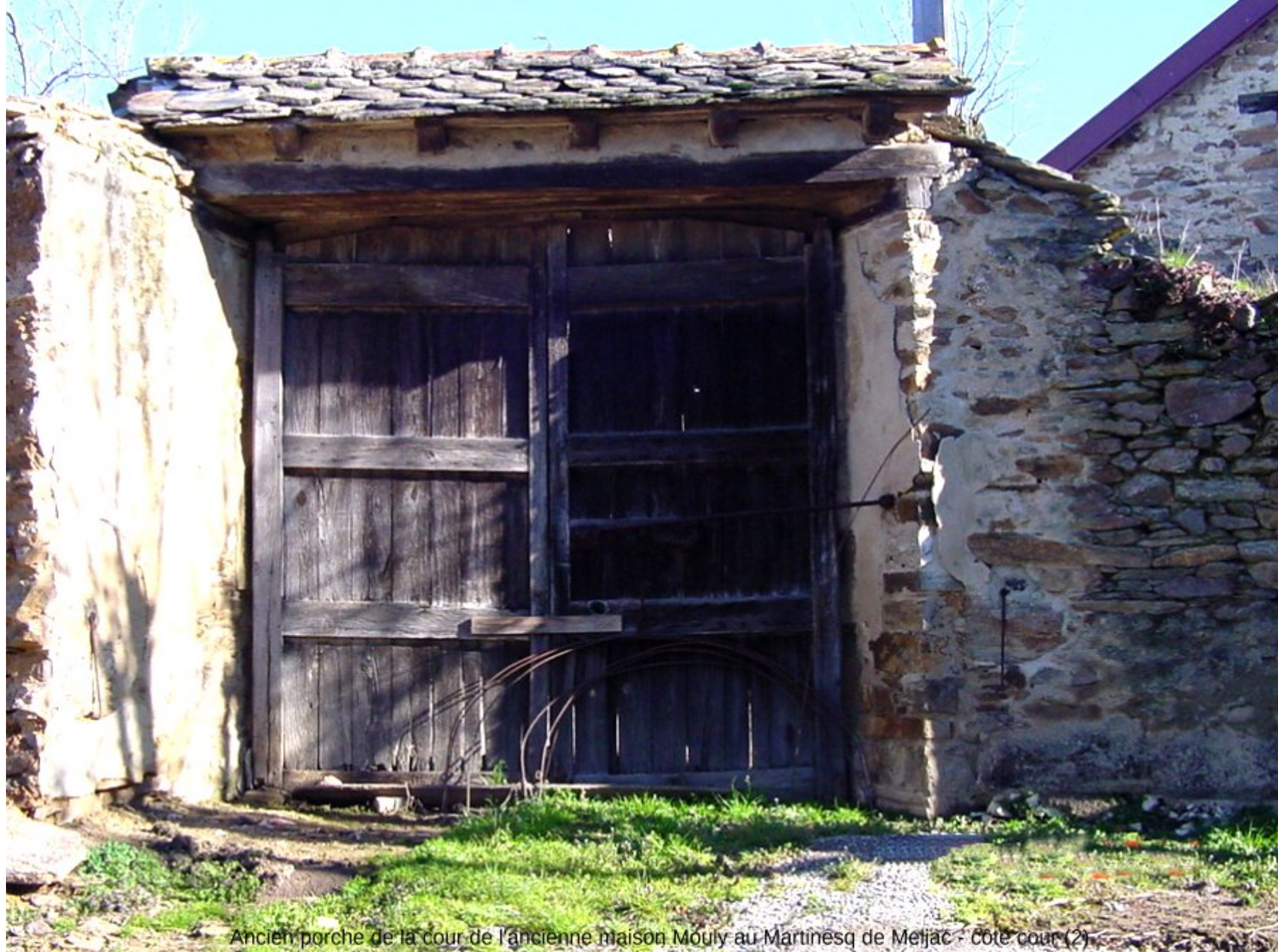
Ancien porche de la cour de l'ancienne maison Mouly au Martinesq de Meljac - côté cour (2)