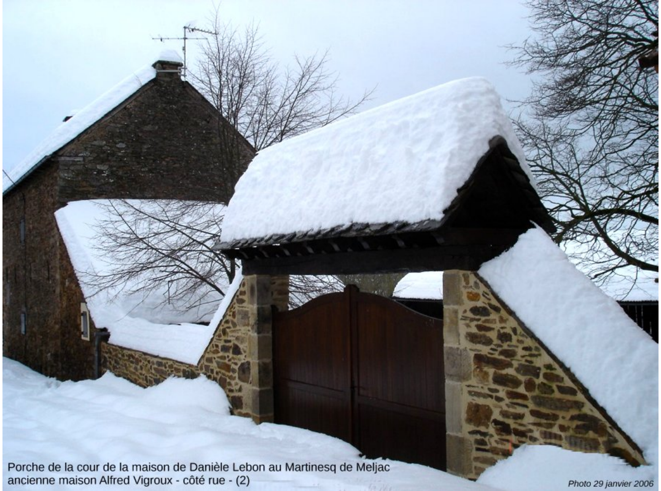
Porche de la cour de la maison de Danièle Lebon au Martinesq de Meljac ancienne maison Alfred Vigroux - côté rue - (2)